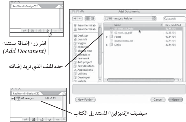
شكل (٨ - ٢) إضافة مستند كتاب

لإضافة مستند إلى لوح «كتاب» (Book)، انقر زر «إضافة مستند» (Add Document) في اللوح، واختر مستنداً من محرك القرص الصلب أو الشبكة (انظر شكل ٨-٢). وإذا لم تكن هناك أية مستندات على اللوح قد تم تحديدها عند إضافة مستند جديد، فإن هذا المستند الجديد سيضاف إلى نهاية القائمة. وإذا حددت مستنداً أولاً، فإن المستند الجديد سيضاف بعد المستند المحدد. ويمكنك أيضاً أن تسحب الملفات مباشرة من «ويندوز إكسبلورر» (Windows Explorer) أو «ماكنتوش فايندر» (Macintosh Finder) إلى داخل لوح الكتاب، وغالباً ما تكون هذه هي أسرع طريقة لإضافة مجلد ممتلئ بالملفات إلى الكتاب.